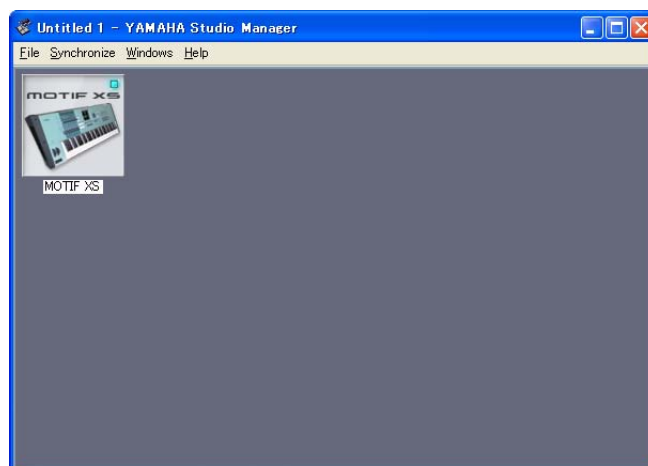
Fenêtre Studio Manager

Dans la fenêtre Studio Manager, double-cliquez sur l'icône du MOTIF XS Editor.